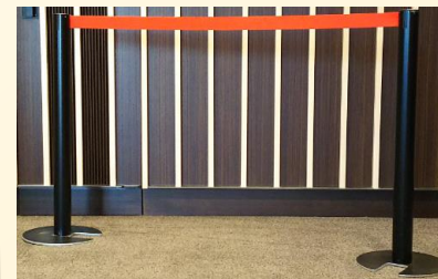
ベルトパーテーション