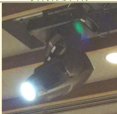
ステージスポット