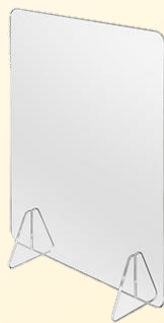
卓上用アクリルパーテーション(透明)