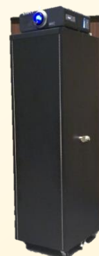
置型プロジェクター