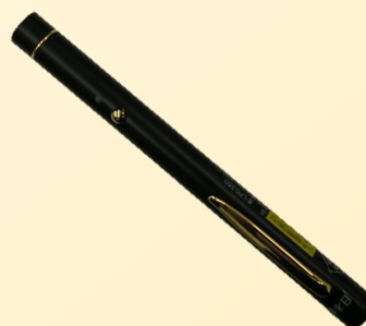
レーザーポインター