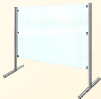
受付用アクリルパーテーション(透明)