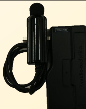
ワイヤレスピンマイク