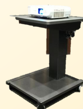
小型プロジェクター