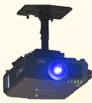
天吊プロジェクター