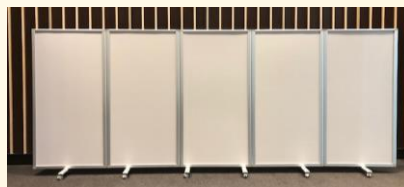
5連パーテーション